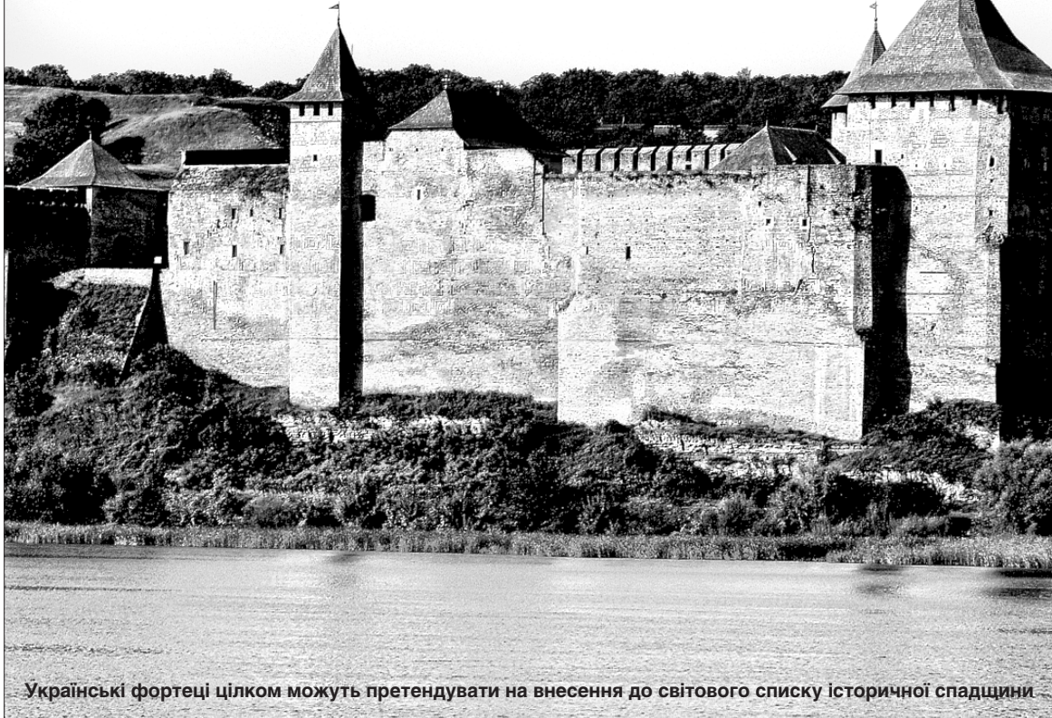
Українські фортеці цілком можуть претендувати на внесення до світового списку історичної спадщини

НАША СПАДЩИНА. Нині, коли міжнародний туризм істотно скоротився, є всі підстави звернути увагу на українські об'єкти, яких багато